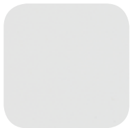
Poudre de marbre