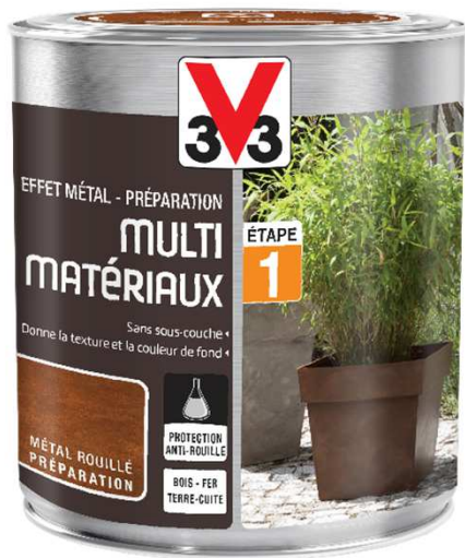
Préparation - 0,5L