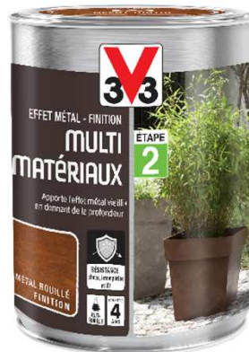
Finition - 0,25L

La superposition des produits Effet Métal Préparation et Effet Métal Finition permet de créer des effets métaux vieillis en donnant profondeur et relief à différents types de matériaux.