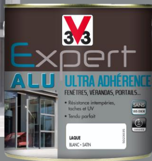
Formats : 0,25L - 0,5L - 2L