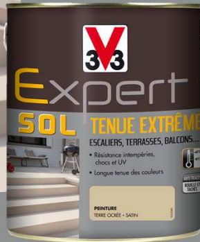
Formats : 0,5L - 2,5L - 3L - 5L